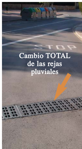
Cambio TOTAL de las rejillas pluviales

Durante el año 2009 hemos realizado obras importantes en nuestro barrio. El "PlanE" nos ha permitido mejorar algunas infraestructuras necesarias que suponen un paso más en la Fontpineda que todos deseamos.