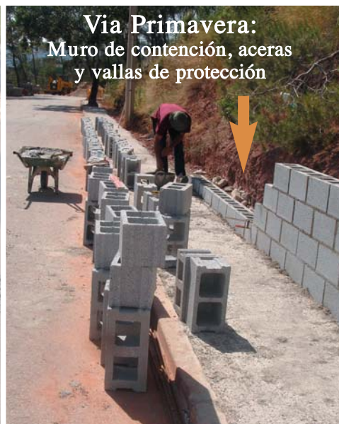
Via Primavera: Muro de contención, aceras y vallas de protección