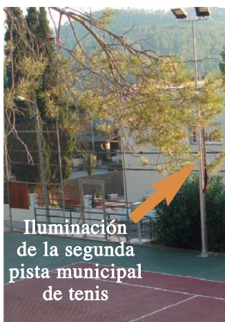
Iluminación de la segunda pista municipal de tenis