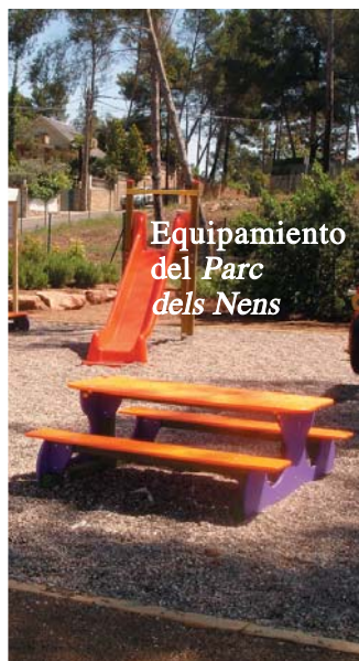
Equipamiento del Parc dels Nens