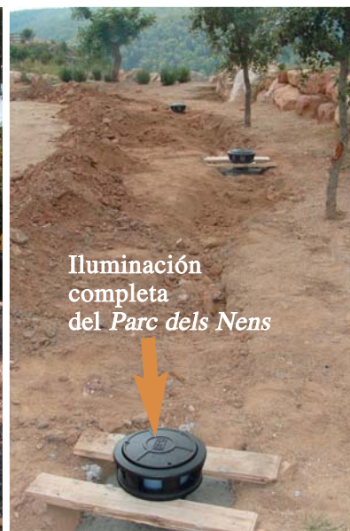
Iluminación completa del Parc dels Nens