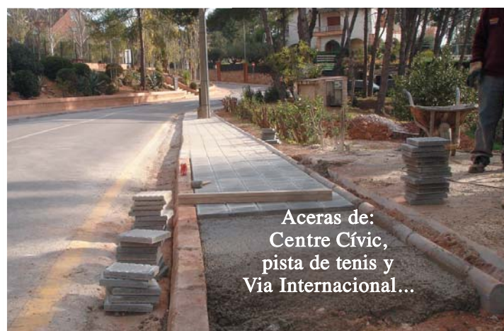
Aceras de: Centre Cívic, pista de tenis y Via Internacional...