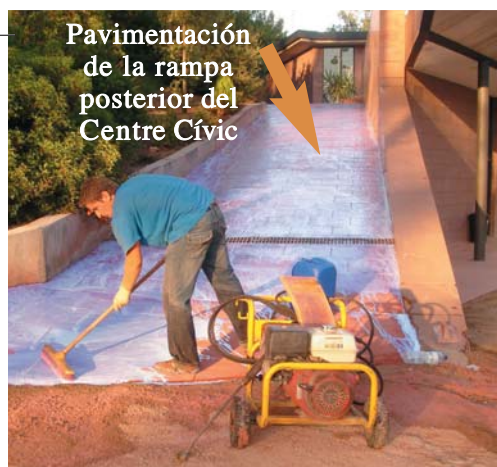
Pavimentación de la rampa posterior del Centre Cívic